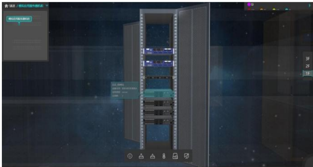
图 2 机柜可视化参考图