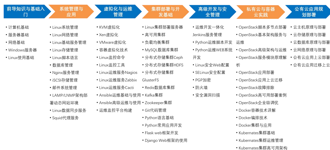
图 1 云计算模块化课程内容规划图

课程规划与云计算技术应用专业人才培养目标相适应，与 1+X 云计算职业技能标准相融通，紧密联系生产劳动实际和社会实践，突出应用性和实践性，注重学生职业能力和解决实际问题能力的培养。