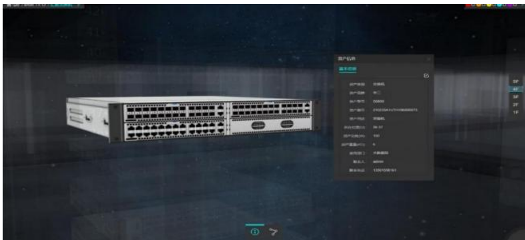
图 3 网络设备参考图