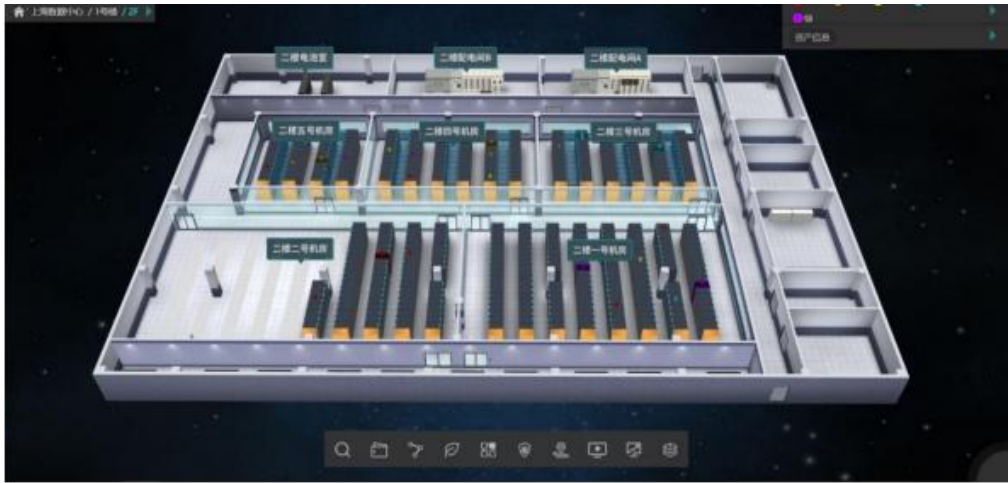
图 1 机房可视化参考图